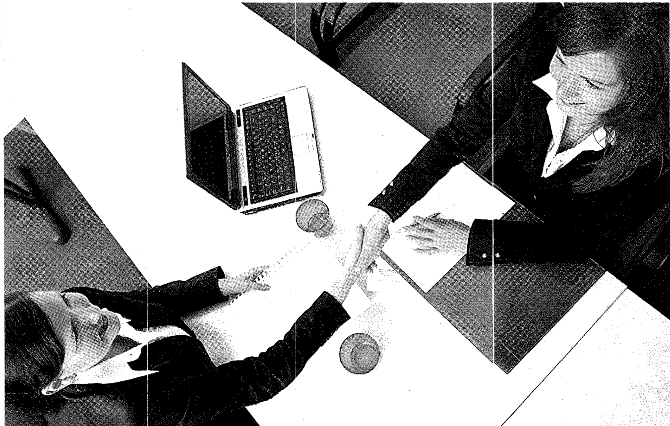
חותרים על הכוואה בבנק. חשוב לבנות מסגרת אשראי נוחה מול הבנקים ולפתח את האשראי החוץ-בנקאי

סדיר וזאת שוב בבנק, אולי באמצעות פריסת הלוואות גדולה יותר לזמן ארוך, וזאת על מנת שנטל החוב יהיה פחות משמעותי, ובזמן ההאטה הם לא יצטרכו להחזיר את כמות האשראי שהם מחזירים כיום". הוא ממליץ לבעלי העסקים להיפטר ממלאי עורף. "לעסקים הקטנים יש בעיקר עסק עם הבנקים ועם הזון עצמי, לכן ערב ההאטה כדאי להם להכין את עצמם להיות כמה שיותר גזיליים עם כספיהם. אותו הדבר לגבי מס: עסקים משלמים כל חודש מס-דומות מס לפי הרווחיות של השנה הקודמת, לכן יש להניח שמקדמות המס יהיו גבוהות יותר. צריך להיות עם האצבע על הדופק בעזרת רואה חשבון כדי לא לשלם מקדמות מס גבוהות יותר. "אני לא חושב שעסקים קטנים ובינוניים ייעלמו בתקופת המיתון. בתקופת ההאטה העסקים הגדולים עלולים רווקא לסבול יותר". adi.hagin@calcalist.co.il